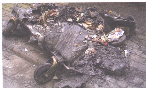
Durch Brand zerstört, das war einmal ein Altpapiercontainer.

unsachgemäßer Behandlung beschädigt oder gänzlich unbrauchbar, so hat der Grundstücksei-